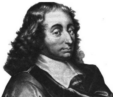
Blaise Pascal (1623-1662)